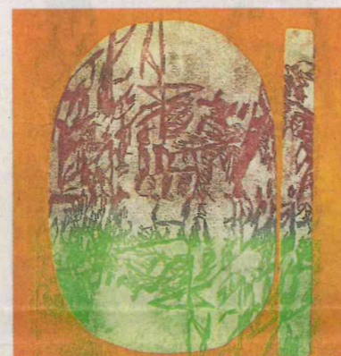
Eva Walker, reprise (1), Mischtechnik auf Leinwand, 2023.

Dirk Rausch thematisiert die Korrelation von Form und Farbe innerhalb des bildkompositionellen Gefüges. Dafür arbeitet er mit zunächst schlicht anmutenden Elementen wie balkenartigen Formationen, die sich in ihrer verschiedenfarbigen Erscheinung so überlagern, dass nuancenreiche Farbdurchdringungen entstehen. Die Positionierung der formalen Aspekte innerhalb des Bildfeldes zeugt von einem ebenso experimentellen wie auch genau durchdachten kompositionellen Anliegen. red/MA